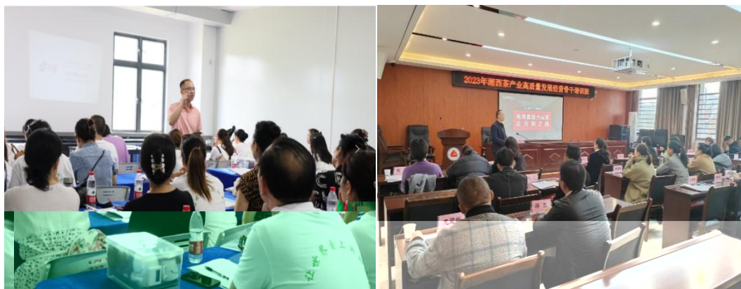
图 企业协助学校为湘西茶企开展电商直播培训

地的合，公不传 电，更关的创创。过大大 供创导，别茶工的操，公 鼓尝、敢创。方供锻 创的，方电操的 合。