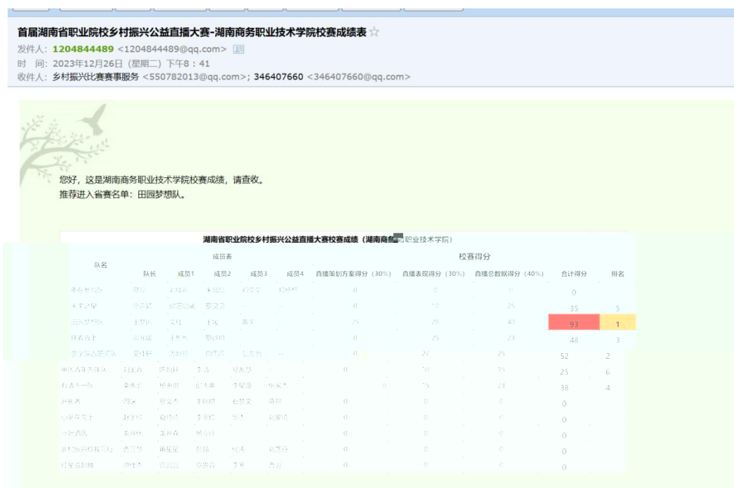
图 湖南商务职业技术学院学生在湖南省首届职业院校乡村振兴直播大赛中获得好成绩

的队。成 的 得 不 对 合 方 的 ， 更 对 公 电 播 导 和 操 的 充 分 。 过 的 度 合 ， 公 不 供 的 播 和 ， 更 比 搭 才 的 ， 、 供 。