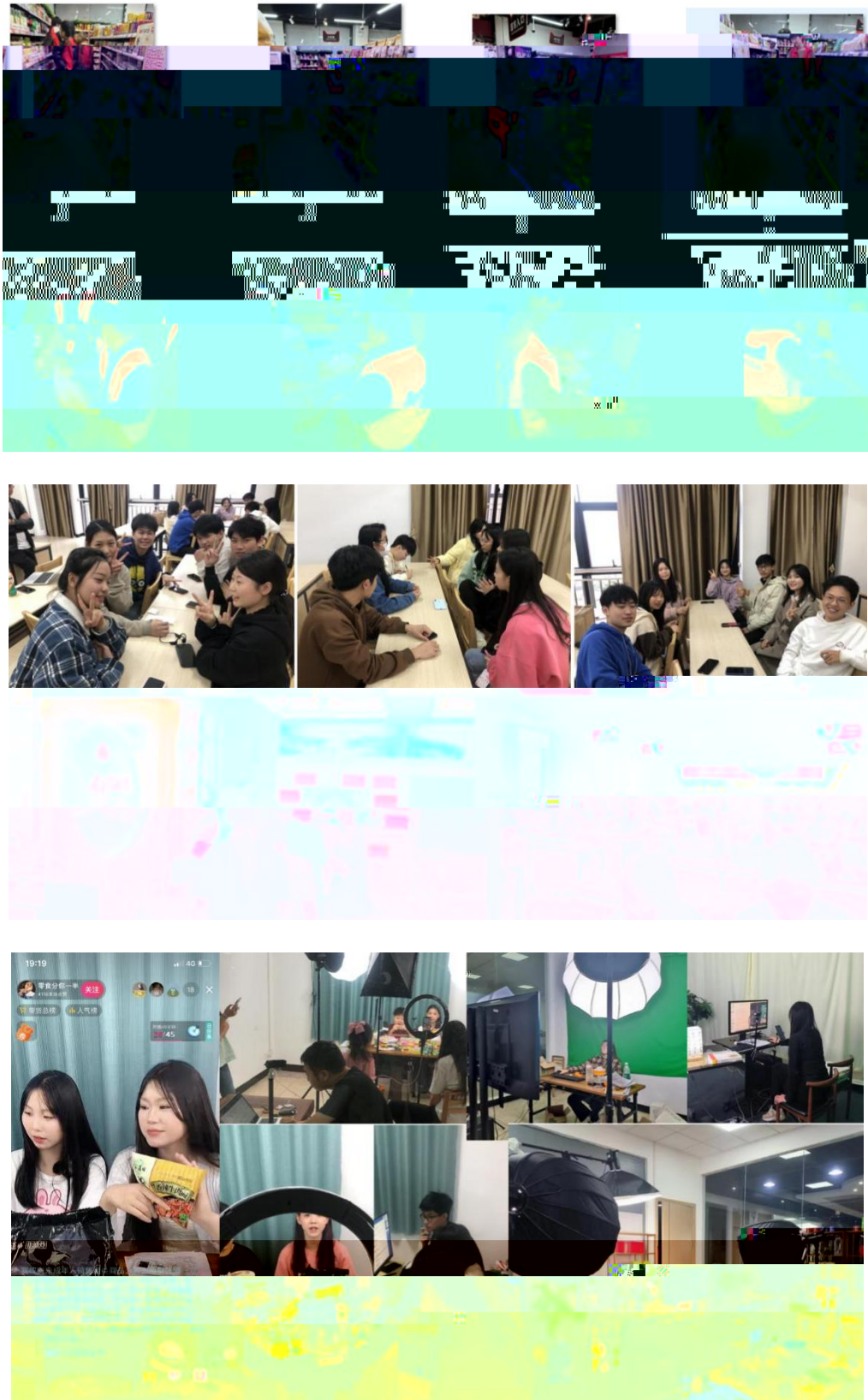
图 组织学生开展实习实训